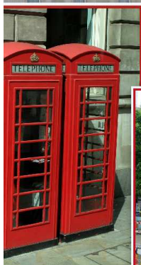
Londres avec l'ANR47 le 21 juin 2015